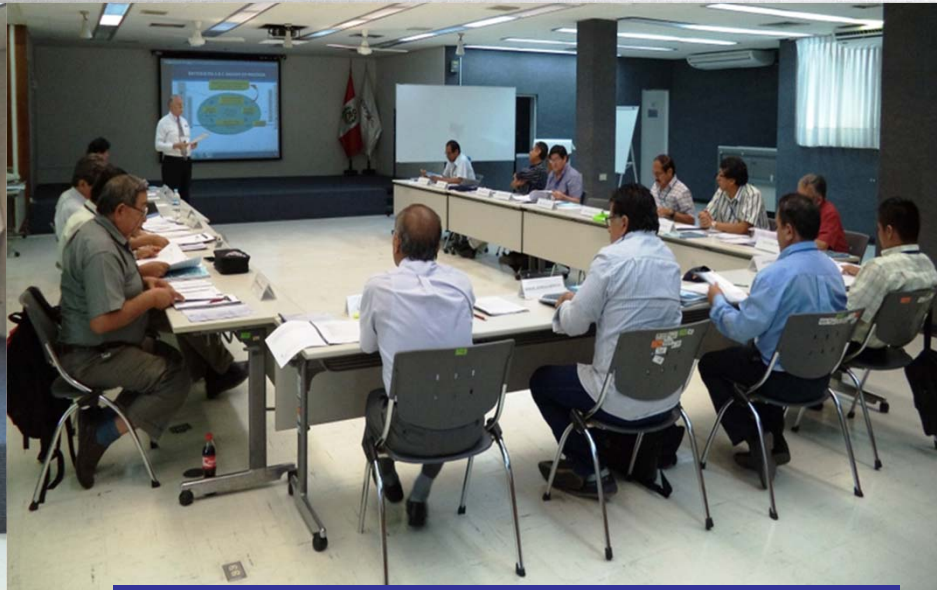
CURSO SISTEMAS DE GESTION DE LA CALIDAD