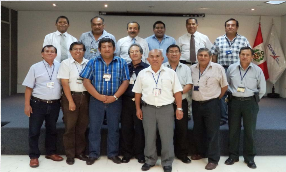
CURSO DE ACTUALIZACION PARA PERSONAL ATSEP