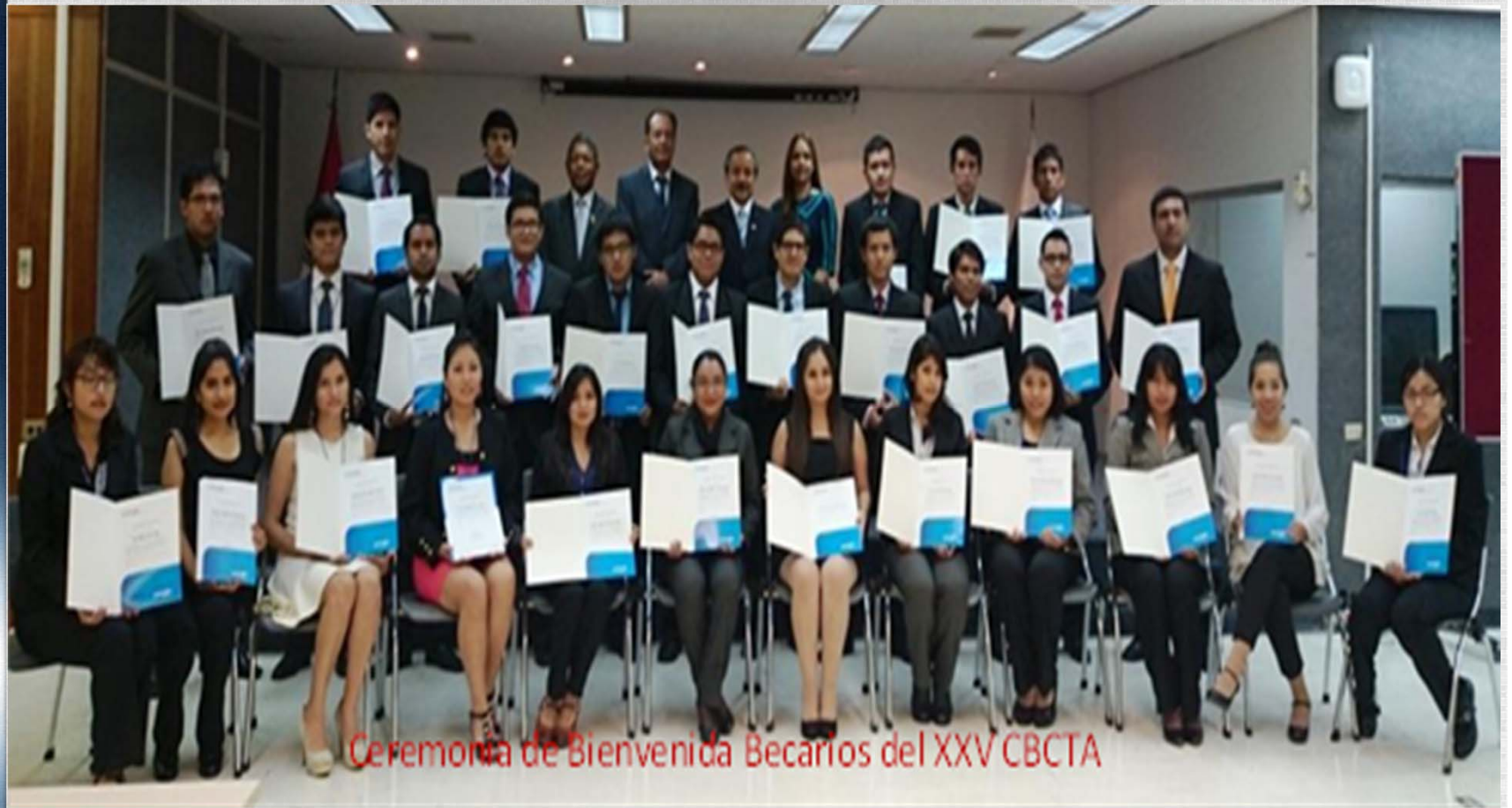
Ceremonia de Bienvenida Becarios del XXV CBCTA