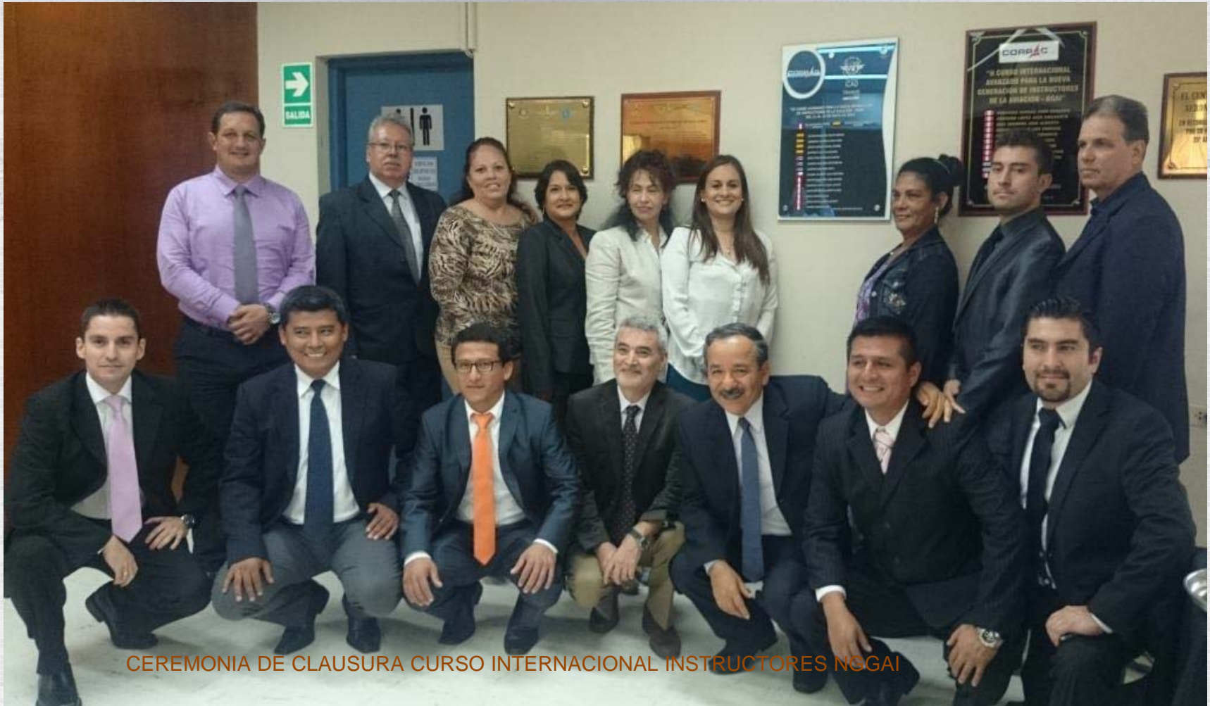
CEREMONIA DE CLAUSURA CURSO INTERNACIONAL INSTRUCTORES NOGAI