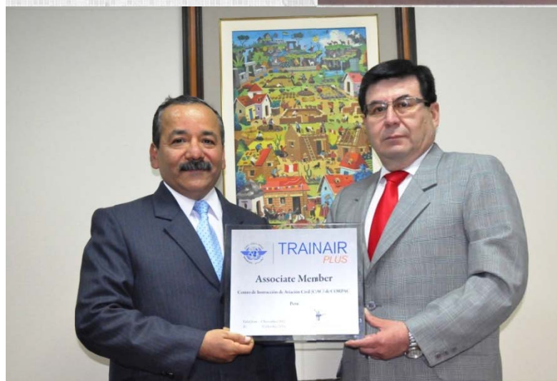
Renovación Membresía 2014-2017