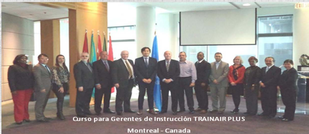
Curso para Gerentes de Instrucción TRAINAIR PLUS